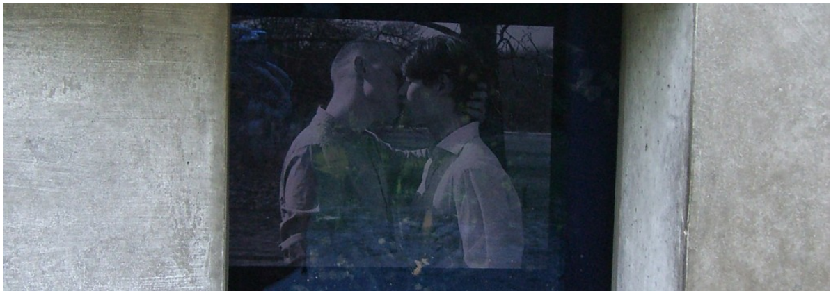
* Monumento a los homosexuales perseguidos en tiempos del nacionalsocialismo, Tiergarten, Berlín

Inicio // Final: Reichstag, Tiergarten // Potsdamer Platz, Tiergarten.