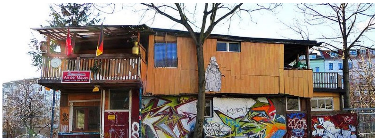
*Casa construida en la copa de un árbol en el Muro, Kreuzberg, Berlin.

Nota: A petición, es posible reservar la actividad Dönersafari como una visita guiada clásica con una duración aproximada de 2 horas, donde contaremos las historias más importantes de este recorrido.